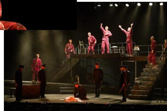
2023年9月公演「星をかすめる風」原作・イ・ジョンミョン 演出・シライケイタ