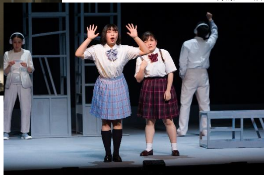
2023年2月公演「行きたい場所をどうぞ」作・瀬戸山美咲 演出・大谷賢治郎