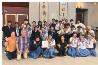
「あの夏の絵」石垣中学校公演記念写真