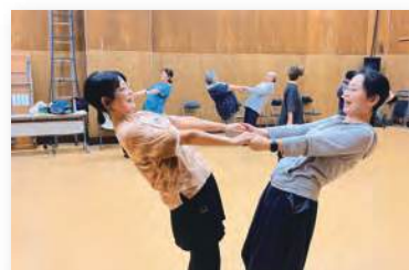
大人のための演劇ワークショップ