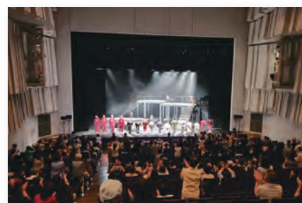
「星をかすめる風」下関市民劇場例会公演 カーテンコール